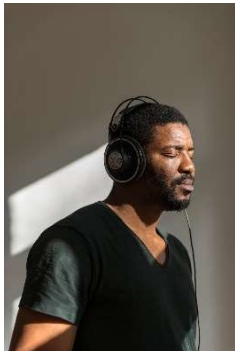
Porträt Emeka Ogboh, © der Künstler, Foto: Michael Danner

Für die Zusendung der Abbildungen bitte kurze Nachricht an Kristina Groß: kristina.gross@ravensburg.de / For sending the images please send a short message to Kristina Groß: kristina.gross@ravensburg.de