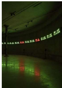
Emeka Ogboh, The Way Earthly Things Are Going, 2017, © der Künstler, Tate Modern 2017