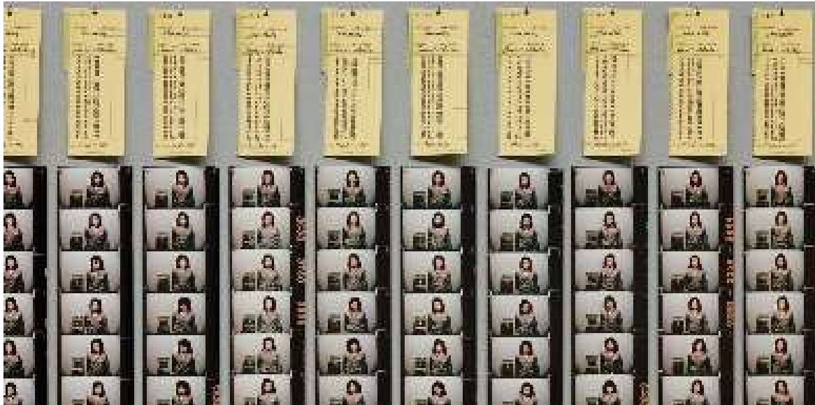
Tehching Hsieh, One Year Performance 1980-1981 (Time Clock-Piece), 1980-1981 (Detail), Ausstellungsansicht Neue Nationalgalerie, Berlin, 2023

Ein Jahr ist die Zeit, in der die Erde die Sonne umrundet, die Einheit, in der wir über das Alter sprechen oder über das Vorübergehen der Zeit. Ein Jahr lang unterwarf sich Tehching Hsieh (*1950) der schwindelerregenden Disziplin, pünktlich zu jeder vollen Stunde die Zeiterkarte einer Stechuhr zu stempeln und parallel ein Selbstporträt aufzunehmen. Seine legendäre Arbeit One Year Performance 1980-1981 (Time Clock Piece) ist eine der kompromisslosesten Meditationen über Zeit und wird zum zweiten Mal in Deutschland gezeigt. Mit dem Time Clock Piece nimmt der taiwanesisch-amerikanische Künstler die Intensität einer Welt vorweg, die niemals schläft.