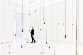
Alicja Kwade, Durchbruch durch Schwäche , 2009, Uhrengewichte (Fragmente), Maße variabel, Sammlung Museum Voorlinden, © die Künstlerin

Für die Zusendung weiterer Abbildungen bitte kurze Nachricht an Lea Daro: lea.daro@ravensburg.de. Das Bildmaterial ist ausschließlich frei zur Berichterstattung. Der Fotonachweis muss erbracht werden.