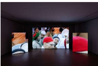
Rafik Greiss, The Longest Sleep , 2024, digitales 6k Video, 9:36 Min., Courtesy der Künstler und Galerie Balice Hertling, © der Künstler, Foto: Aurélien Mole