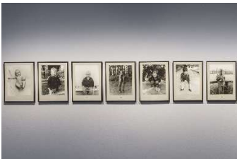
Hans-Peter Feldmann, 100 JAHRE , 1998–2000, 101 Gelatinesilberabzügen auf Barytpapier, je 44 × 32 cm, Sammlung Hans-Jörg und Regine Reisch, Courtesy Mehdi Chouakri, Berlin, © VG Bild-Kunst, Bonn 2026, Foto (Detail): David von Becker